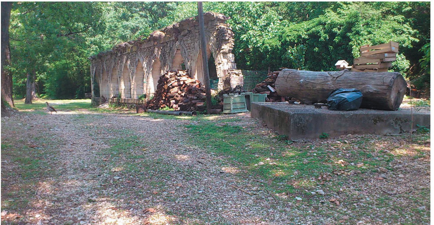
Reportage photo à la vallée de l'Eure - Sortie SVT des classes de 6ème et 5ème - mai 2012